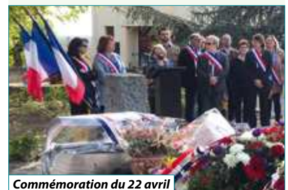
Commémoration du 22 avril