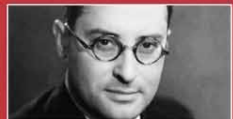
Hommage à Jean Zay p.6