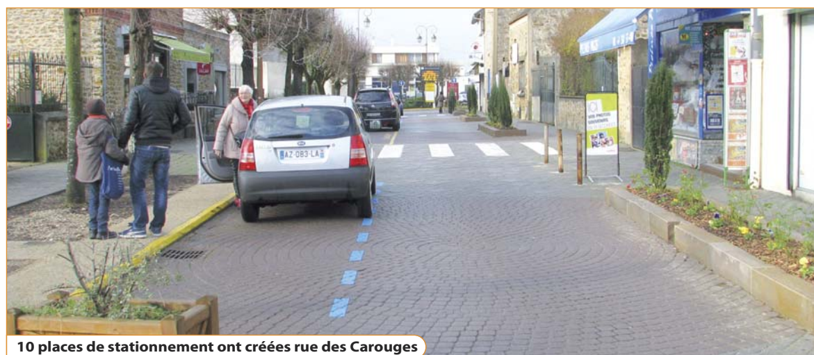
10 places de stationnement ont créées rue des Carouges

Les différentes étapes de réalisation de la boucle de centre-ville sont à retrouver en vidéo sur le site : www.mairie-vaux-le-penil.fr