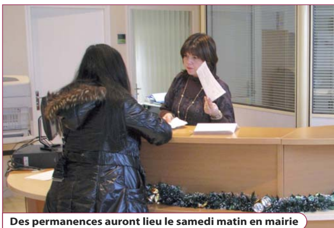
Des permanences auront lieu le samedi matin en mairie

Ces démarches, ainsi que les légalisations de signature, pourront aussi être effectuées en mairie le samedi de 9h00 à 12h00 (la première se tiendra le 21 janvier). En revanche, le service population ne délivrera pas d'actes d'état civil ou d'autres attestations pendant la permanence du samedi.