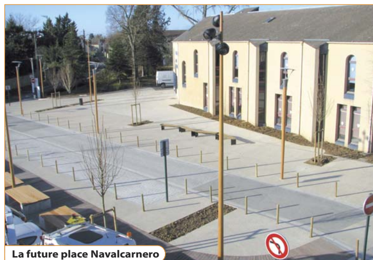
La future place Navalcarnero

En fin de matinée, les conseillers municipaux se sont retrouvés rue des Carouges pour déguster le chocolat et le vin chauds offerts par Vaux Commerces (gentillesse des établissements Béato, Courtet et Lély), l'association des commerçants pénivaugeois ayant fait de l'ouverture de la boucle le point d'orgue de sa traditionnelle semaine d'animations de Noël. Rappelons que le projet a été adopté à l'unanimité par le Conseil Municipal en janvier dernier. Puis les élus empruntèrent à pied le parcours jalonné d'aménagements paysagers, qui fait la part belle aux piétons et aux cyclistes.