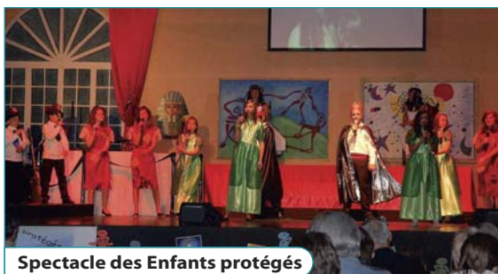
Spectacle des Enfants protégés