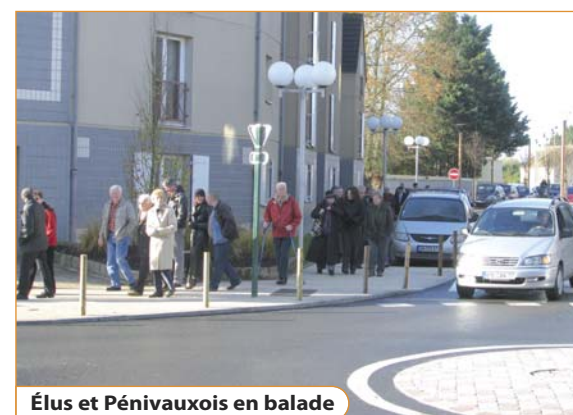
Élus et Pénivaugeois en balade