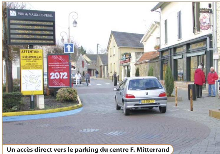
Un accès direct vers le parking du centre F. Mitterrand