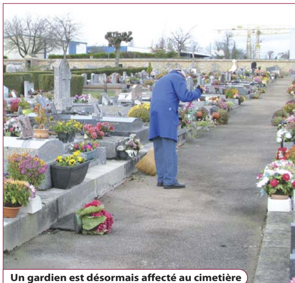
Un gardien est désormais affecté au cimetière