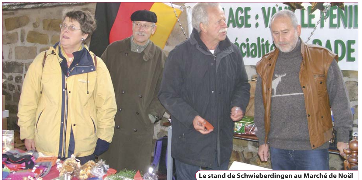
Le stand de Schwieberdingen au Marché de Noël