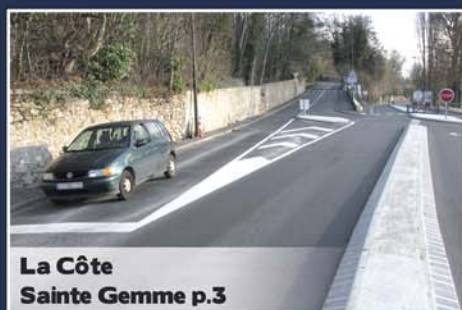
La Côte Sainte Gemme p.3