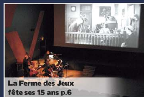
La Ferme des Jeux fête ses 15 ans p.6