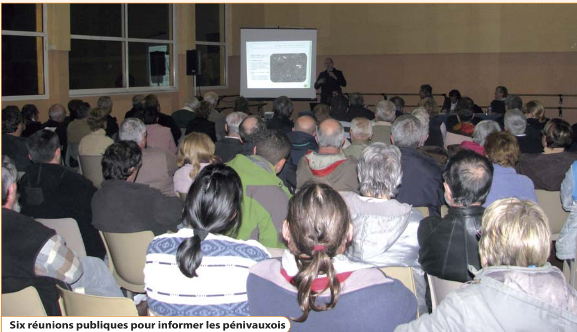
Six réunions publiques pour informer les pénivauxois