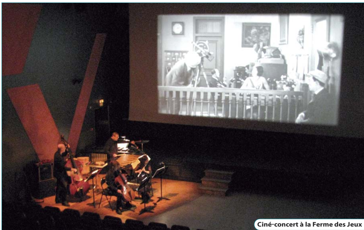
Ciné-concert à la Ferme des Jeux

Le programme détaillé sera bientôt disponible aux accueils municipaux. Renseignements : 01 64 71 91 28.