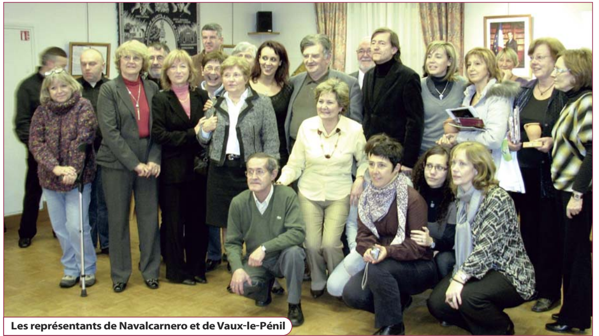
Les représentants de Navalcarnero et de Vaux-le-Pénil

D'autre part, nos amis allemands de Schwieberdingen ont tenu un stand au Marché de Noël, qui a remporté un grand succès auprès des visiteurs. En 2010, le vingtième anniversaire du jumelage entre Vaux-le-Pénil et la cité du Bade-Württemberg sera fêté comme il se doit.