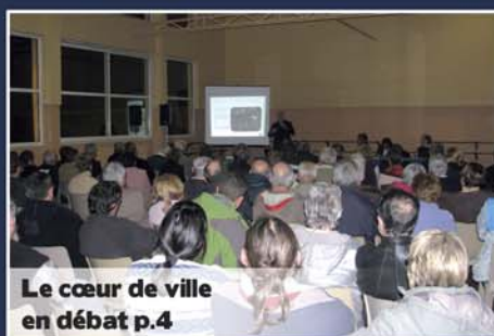
Le cœur de ville en débat p.4