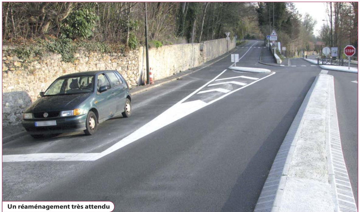
Un réaménagement très attendu