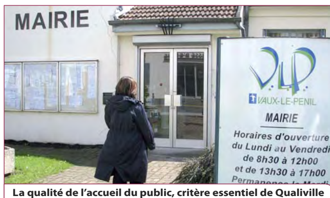
La qualité de l'accueil du public, critère essentiel de Qualiville

Par ailleurs, des indicateurs de résultat sont établis tous les mois et publiés sur le site Internet de la Ville. Les résultats s'avèrent très positifs. Rendez-vous est pris l'an prochain pour l'amorce d'un nouveau cycle de trois ans, avec de nouvelles exigences et la même implication du personnel communal.