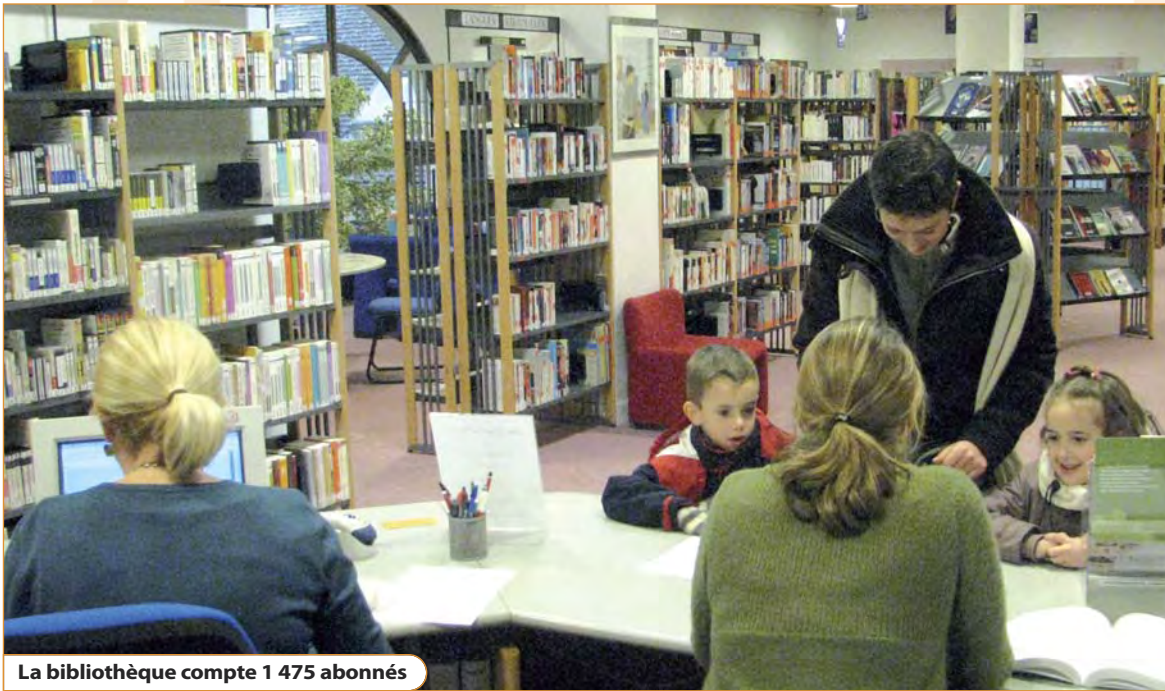
La bibliothèque compte 1 475 abonnés

La bibliothèque municipale dispose d'un fonds de 60 000 ouvrages et de 88 abonnements à des périodiques. Espace multimédia et CD-Rom complètent cet équipement, où de nombreuses animations sont proposées au public.