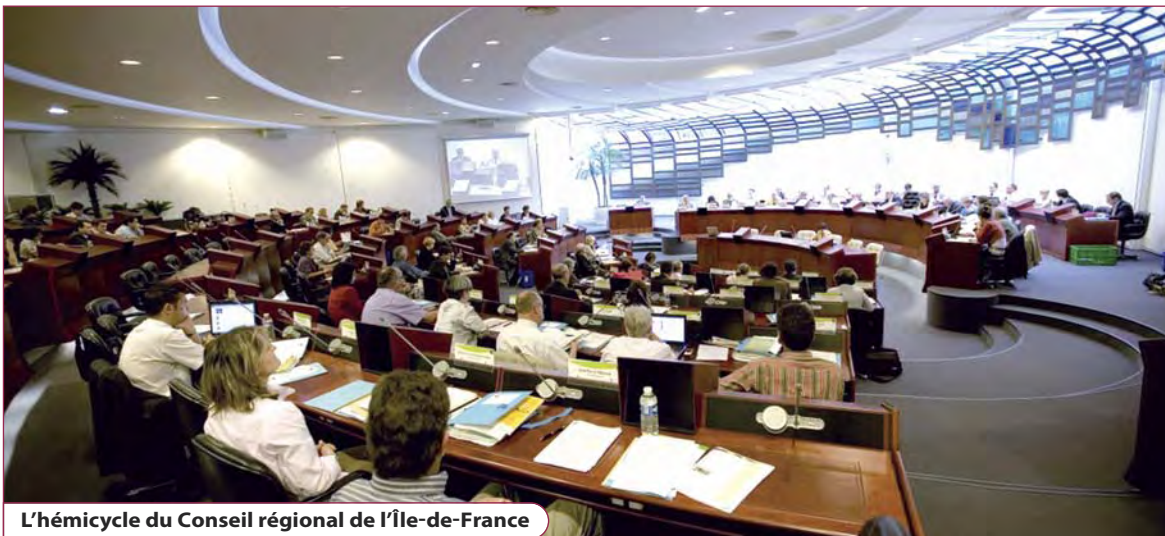
L'hémicycle du Conseil régional de l'Île-de-France