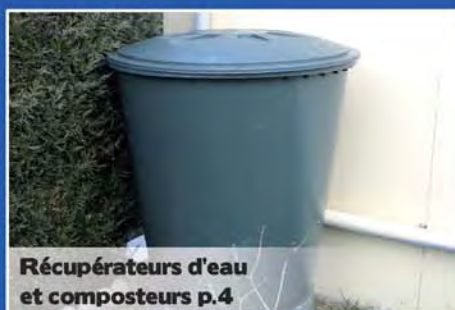
Récupérateurs d'eau et composteurs p.4