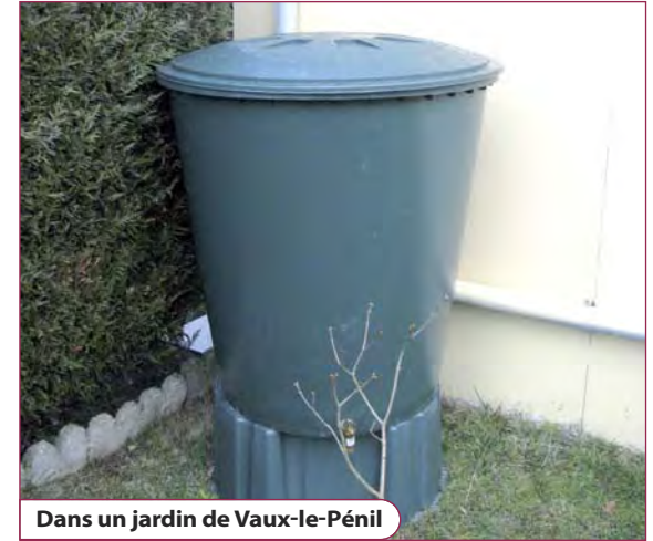
Dans un jardin de Vaux-le-Pénil

La commune renouvelle la mise en vente de récupérateurs d'eau, le SMITOM-LOMBRIC lance celle de composteurs.