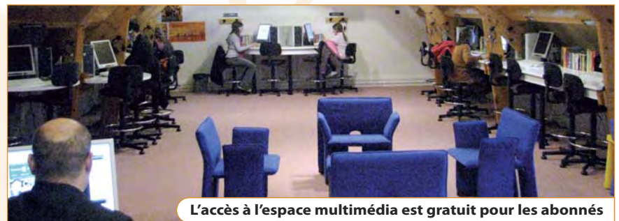
L'accès à l'espace multimédia est gratuit pour les abonnés

Ce sont aussi nos bibliothécaires qui programment et organisent les animations. En permanence, une exposition est présentée au public. Depuis la rentrée de septembre, l'Inde a succédé aux animaux fabuleux des contes et légendes, avant de céder la place aux illustrations de livres pour la jeunesse d'Éric Puybaret. Chaque année, la poésie est à l'honneur avec le concours de printemps et le cycle Musique et Poésie, qui associe lecture et musique autour d'auteurs prestigieux tels Brassens ou Aimé Césaire.