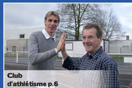
Club d'athlétisme p.6