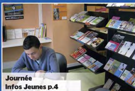
Journée Infos Jeunes p.4