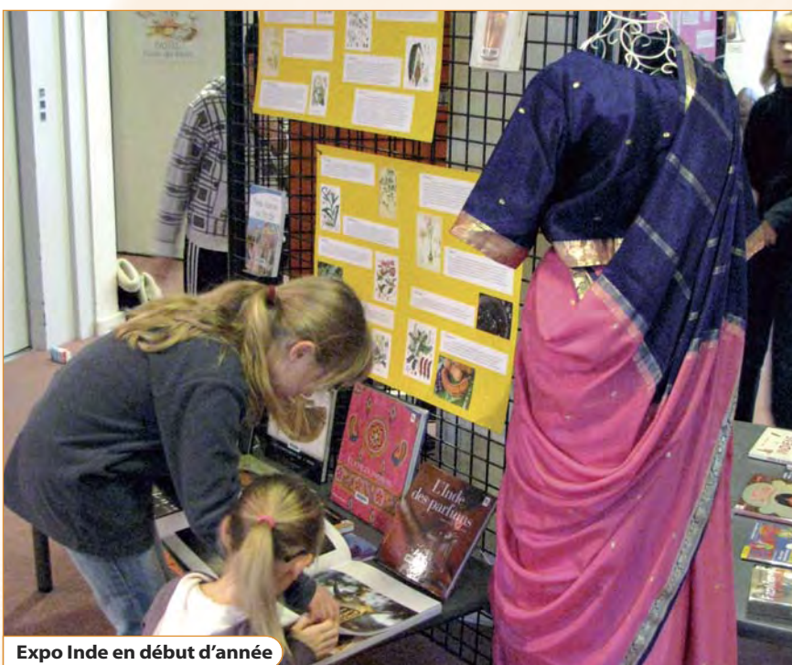
Expo Inde en début d'année

À Noël, un spectacle est destiné aux enfants. Quant aux tout-petits nés en 2009, ils se voient remettre un livre à la bibliothèque, grâce à un dispositif monté par la CAF et le Conseil général. Car même à l'époque où fleurissent les nouvelles technologies, la lecture reste un passeport unique pour le rêve et la connaissance.