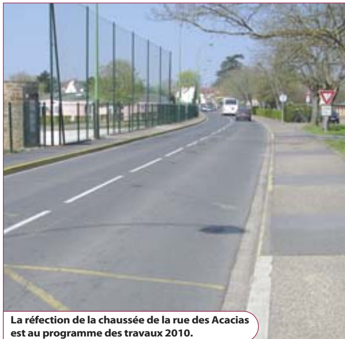
La réfection de la chaussée de la rue des Acacias est au programme des travaux 2010.

Assurer la qualité du présent tout en préparant activement l'avenir, ainsi pourraient être résumées les grandes lignes de ce budget 2010.