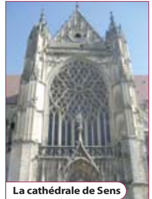
La cathédrale de Sens