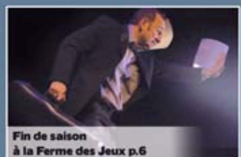
Fin de saison à la Ferme des Jeux p.6