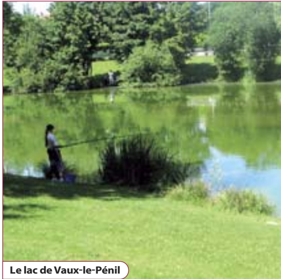
Le lac de Vaux-le-Pénil

À chaque printemps, les services techniques municipaux plantent différentes espèces sur le territoire communal. Une première cette année : des rosiers en centre-ville, recouverts d'un paillage qui retient l'eau et diminue du même coup l'arrosage. Tout comme le bannissement des désherbants chimiques et autres produits phytosanitaires polluants, cette nouvelle façon d'entretenir les plantations s'inscrit dans le code de bonne conduite environnementale suivi par les services municipaux.