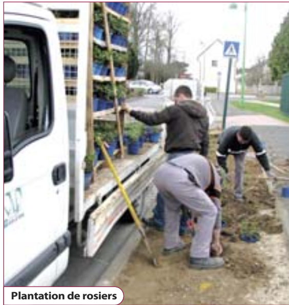
Plantation de rosiers