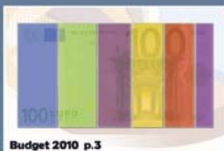
Budget 2010 p.3