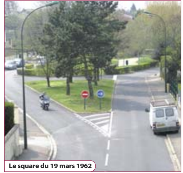
Le square du 19 mars 1962

Horaire d'été de la déchetterie. Valable jusqu'au 31 octobre. Du lundi au vendredi : de 15h00 à 19h00. Samedi : de 10h00 à 19h00. Dimanche : de 10h00 à 13h00.