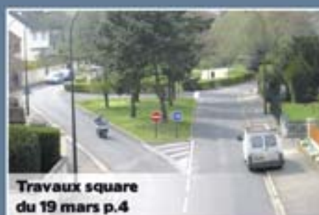
Travaux square du 19 mars p.4