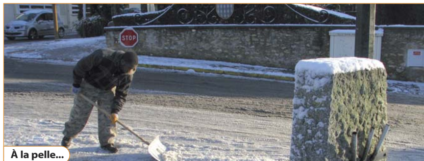
À la pelle...