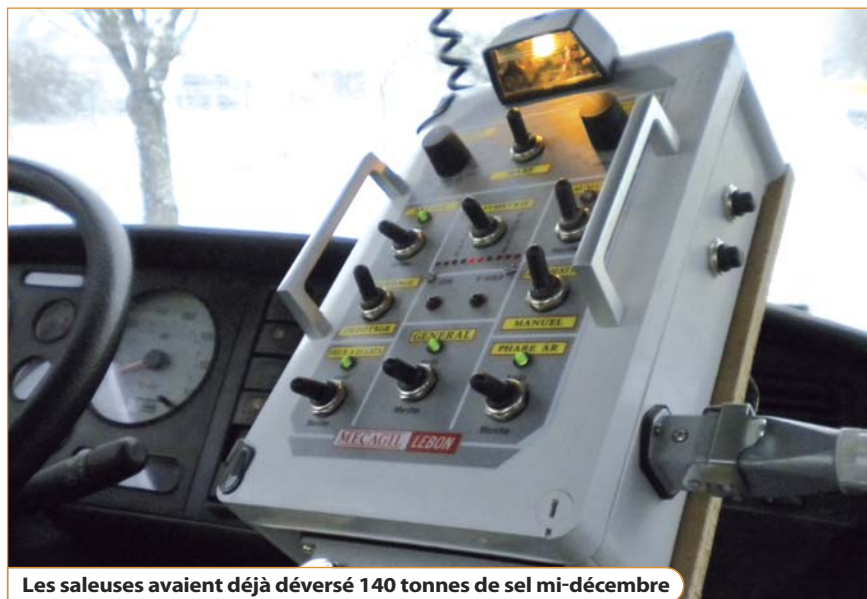
Les saleuses avaient déjà déversé 140 tonnes de sel mi-décembre