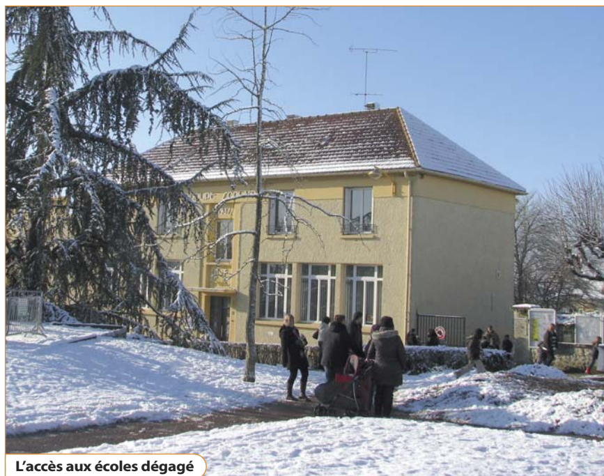
L'accès aux écoles dégagé

Enfin, le conseiller municipal en appelle au civisme : « La loi rend chaque riverain responsable du déneigement du trottoir qui borde son habitation, non seulement devant sa porte mais sur toute la longueur de son terrain. J'ajoute que le stationnement sauvage des véhicules sur les trottoirs constitue un obstacle supplémentaire pour les piétons. Pensons aux enfants, aux personnes âgées! » L'hiver est là, avec ses aléas : pouvoir se déplacer ne dépend pas seulement des services municipaux, c'est l'affaire de tous.