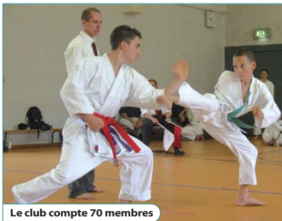
Le club compte 70 membres