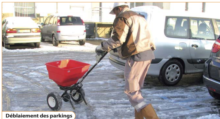
Déblaiement des parkings