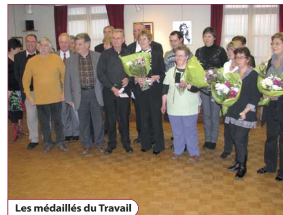
Les médaillés du Travail