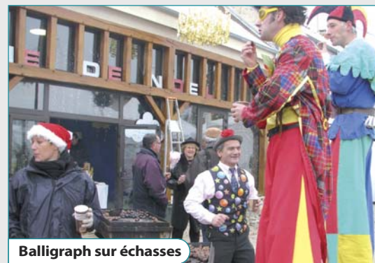
Balligraph sur échasses