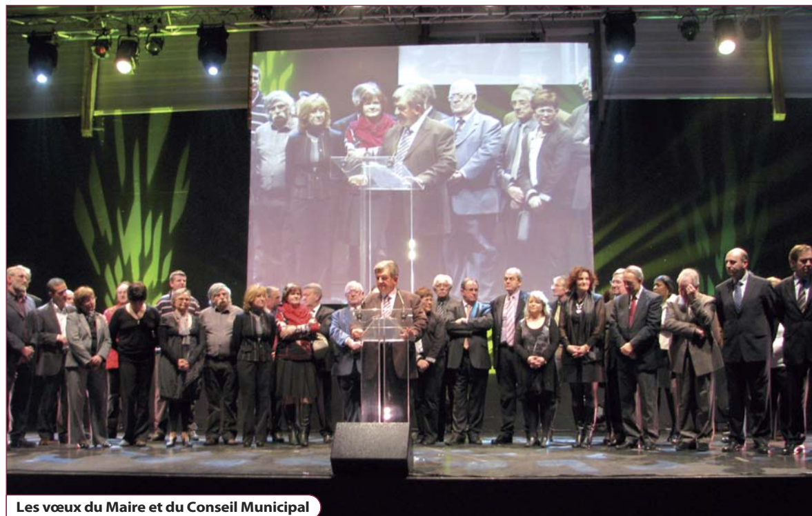
Les vœux du Maire et du Conseil Municipal