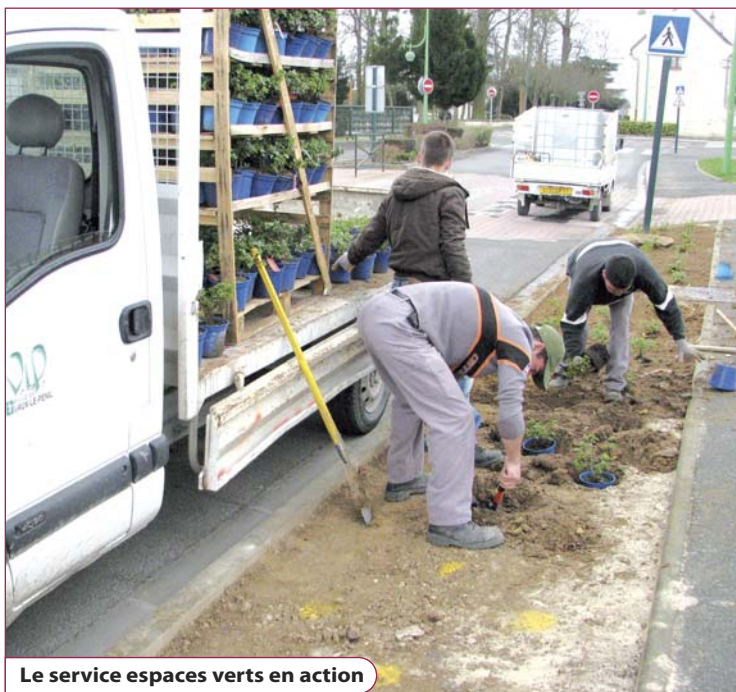
Le service espaces verts en action

Exemple : les parterres maçonnés remplacent les bacs qui présentaient un taux d'évaporation important ; ils peuvent, de plus, être fertilisés par le compost obtenu à partir du broyage des végétaux. Autre exemple : le choix des variétés - bégonias, géraniums, fuchsias, ... - permet d'associer économie d'arrosage, longévité des plants et diversité des couleurs.