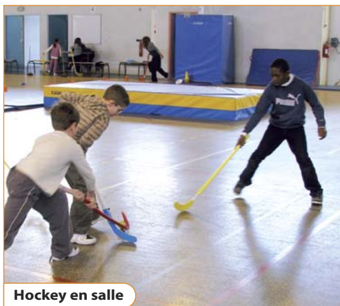
Hockey en salle

Chaque année, la Ville consacre d'importants moyens à l'éducation sportive et artistique dans les écoles de Vaux-le-Pénil.