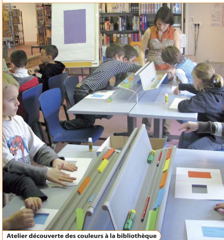
Atelier découverte des couleurs à la bibliothèque

La Ferme des Jeux n'est pas en reste. Quelque 800 élèves de maternelle et de primaire bénéficient du dispositif École et cinéma , financé par la Mairie, qui leur permet de voir gratuitement 6 films dans l'année. Quant aux spectacles vivants "jeune public" programmés dans le cadre de la saison culturelle, ils donnent lieu en journée à des séances spéciales réservées aux scolaires.