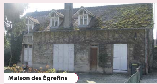
Maison des Égrefins

Un dossier complet et illustré de ces ventes est disponible au service urbanisme, 479bis rue de la Justice. Tél. : 01 64 10 46 96 ou auprès de Gérald Babillotte : 01 64 10 46 91. Le dossier est également consultable sur www.mairie-vaux-le-penil.fr