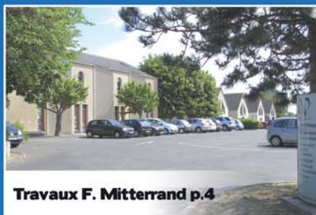
Travaux F. Mitterrand p.4