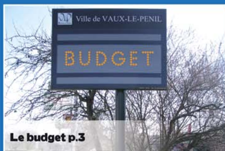
Le budget p.3