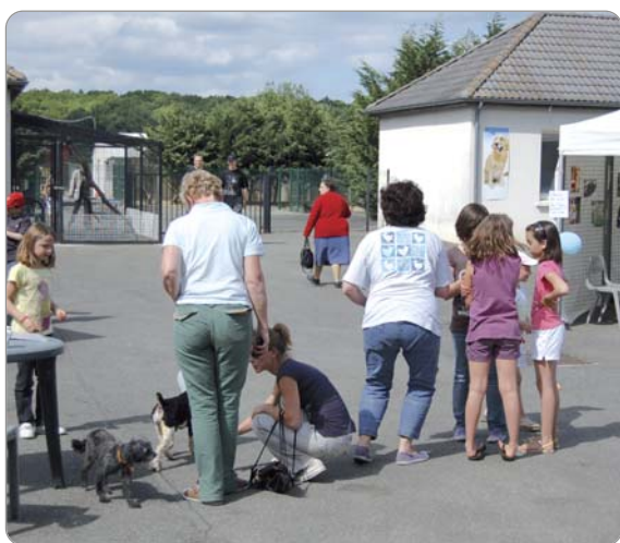
Portes ouvertes de la SPA