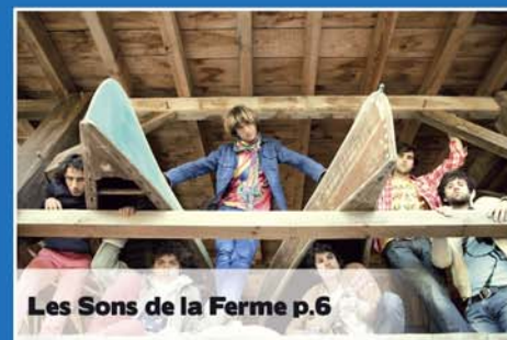
Les Sons de la Ferme p.6