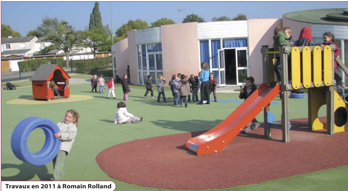
Travaux en 2011 à Romain Rolland

Et globalement, Vaux-le-Pénil reste l'une des villes de Seine-et-Marne de plus de 10 000 habitants où les taux d'imposition sont les plus faibles.