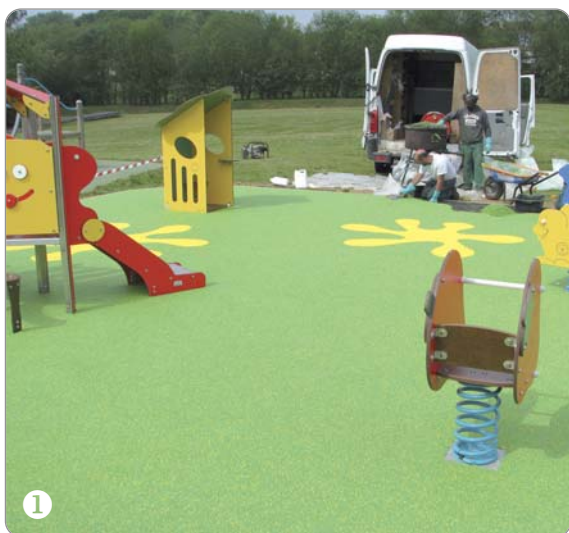
Nouvelle aire de jeux

La Ville a fait construire une nouvelle aire de jeux (1) pour enfants jusqu'à 6 ans au parc de loisirs de la Buissonnière. Cet équipement comporte un toboggan, une maisonnette et trois jeux à ressort. Il est doté d'un sol sécurisé spécialement adapté aux activités des tout-petits. Square du 19 mars (2), les travaux de construction du bassin de rétention de l'eau pluviale sont entrés dans leur phase finale. D'une grande capacité de stockage, le réservoir permettra d'éradiquer les risques d'inondation dans le secteur de la Noue. Ce chantier est financé par la CAMVS, tout comme l'est la réhabilitation des deux axes structurants de la zone industrielle : la rue Georges Clemenceau et l'avenue Saint-Just (3). Réfection des trottoirs, aménagements de pistes cyclables et piétonnières, mise en place de giratoires, nouveaux éclairages, espaces verts sont les principales innovations de cette requalification.