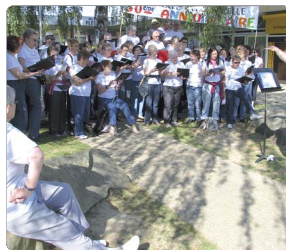
Aubades de Chanterelle