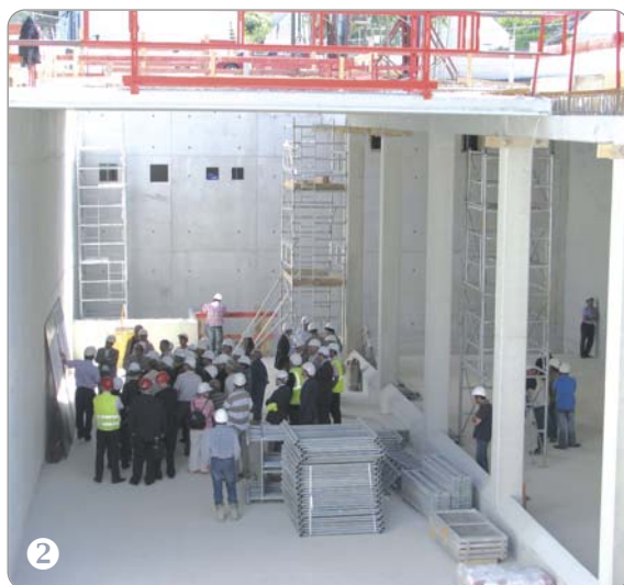
Bassin de rétention

La Ville a fait construire une nouvelle aire de jeux (1) pour enfants jusqu'à 6 ans au parc de loisirs de la Buissonnière. Cet équipement comporte un toboggan, une maisonnette et trois jeux à ressort. Il est doté d'un sol sécurisé spécialement adapté aux activités des tout-petits. Square du 19 mars (2), les travaux de construction du bassin de rétention de l'eau pluviale sont entrés dans leur phase finale. D'une grande capacité de stockage, le réservoir permettra d'éradiquer les risques d'inondation dans le secteur de la Noue. Ce chantier est financé par la CAMVS, tout comme l'est la réhabilitation des deux axes structurants de la zone industrielle : la rue Georges Clemenceau et l'avenue Saint-Just (3). Réfection des trottoirs, aménagements de pistes cyclables et piétonnières, mise en place de giratoires, nouveaux éclairages, espaces verts sont les principales innovations de cette requalification.