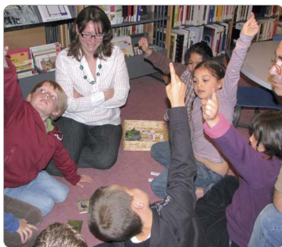
"Poules, oies, canards et cie", exposition à la bibliothèque