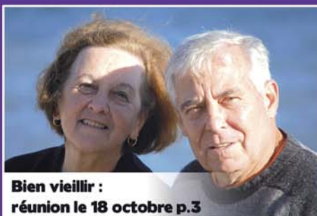
Bien vieillir : réunion le 18 octobre p.3