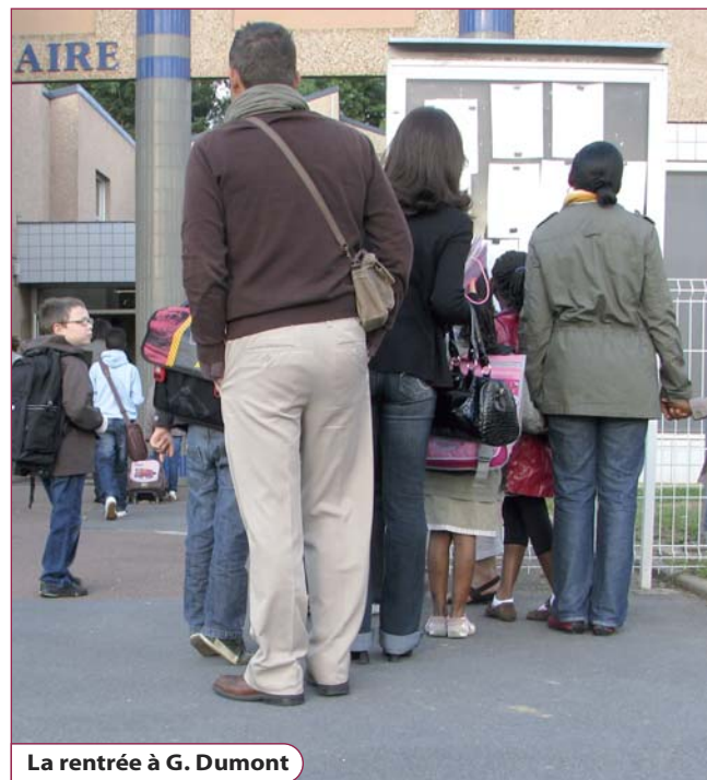
La rentrée à G. Dumont

À partir de fin mai 2012, les familles recevront leur certificat d'affectation accompagné d'un courrier qui leur permettra de confirmer leur inscription auprès du chef d'établissement.