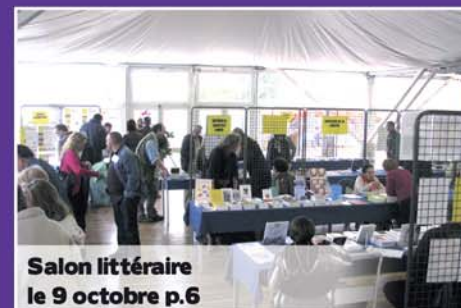
Salon littéraire le 9 octobre p.6