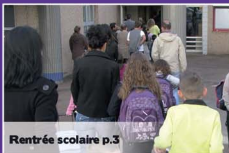
Rentrée scolaire p.3