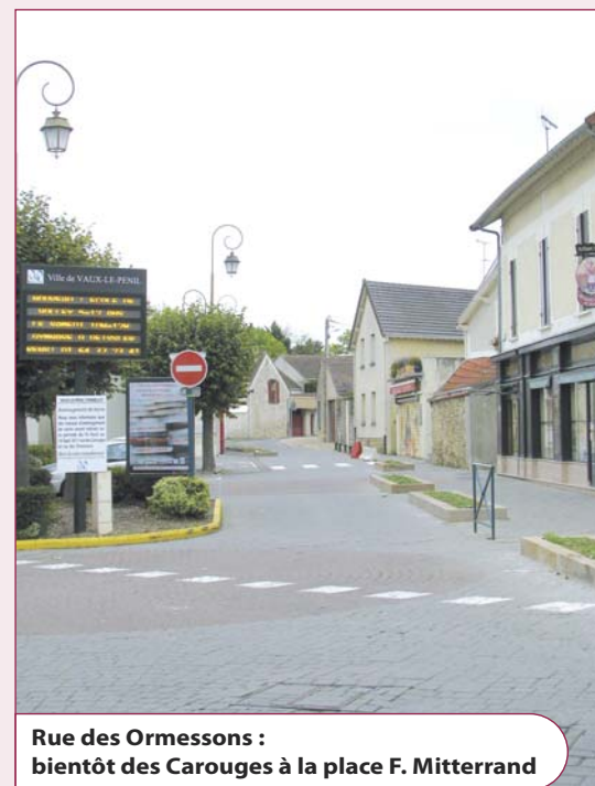
Rue des Ormessons : bientôt des Carouges à la place F. Mitterrand