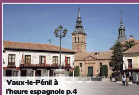
Vaux-le-Pénil à l'heure espagnole p.4