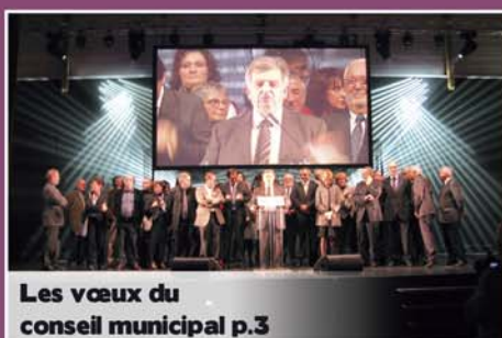
Les vœux du conseil municipal p.3