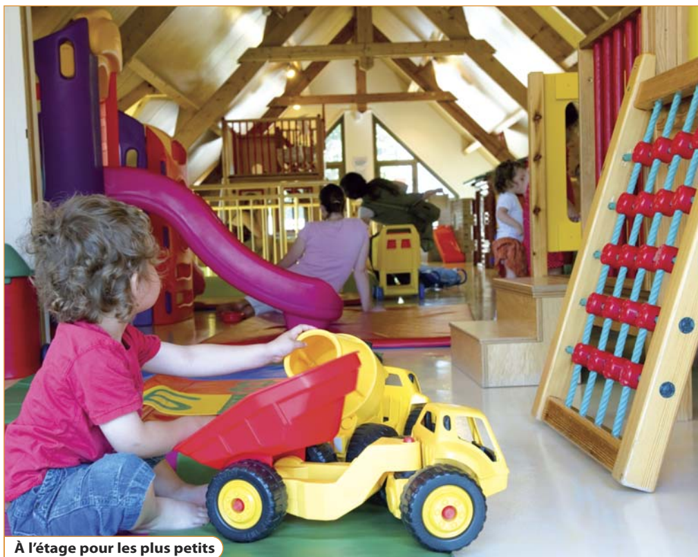
À l'étage pour les plus petits

Horaires d'ouverture : mardi de 16h00 à 18h00 ; mercredi de 10h00 à 12h00 et de 14h00 à 18h00 ; vendredi de 16h00 à 18h00 ; samedi de 10h00 à 12h00 et de 14h00 à 17h00. Renseignements : 01 64 71 51 63.