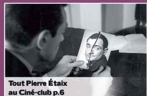
Tout Pierre Était au Ciné-club p.6