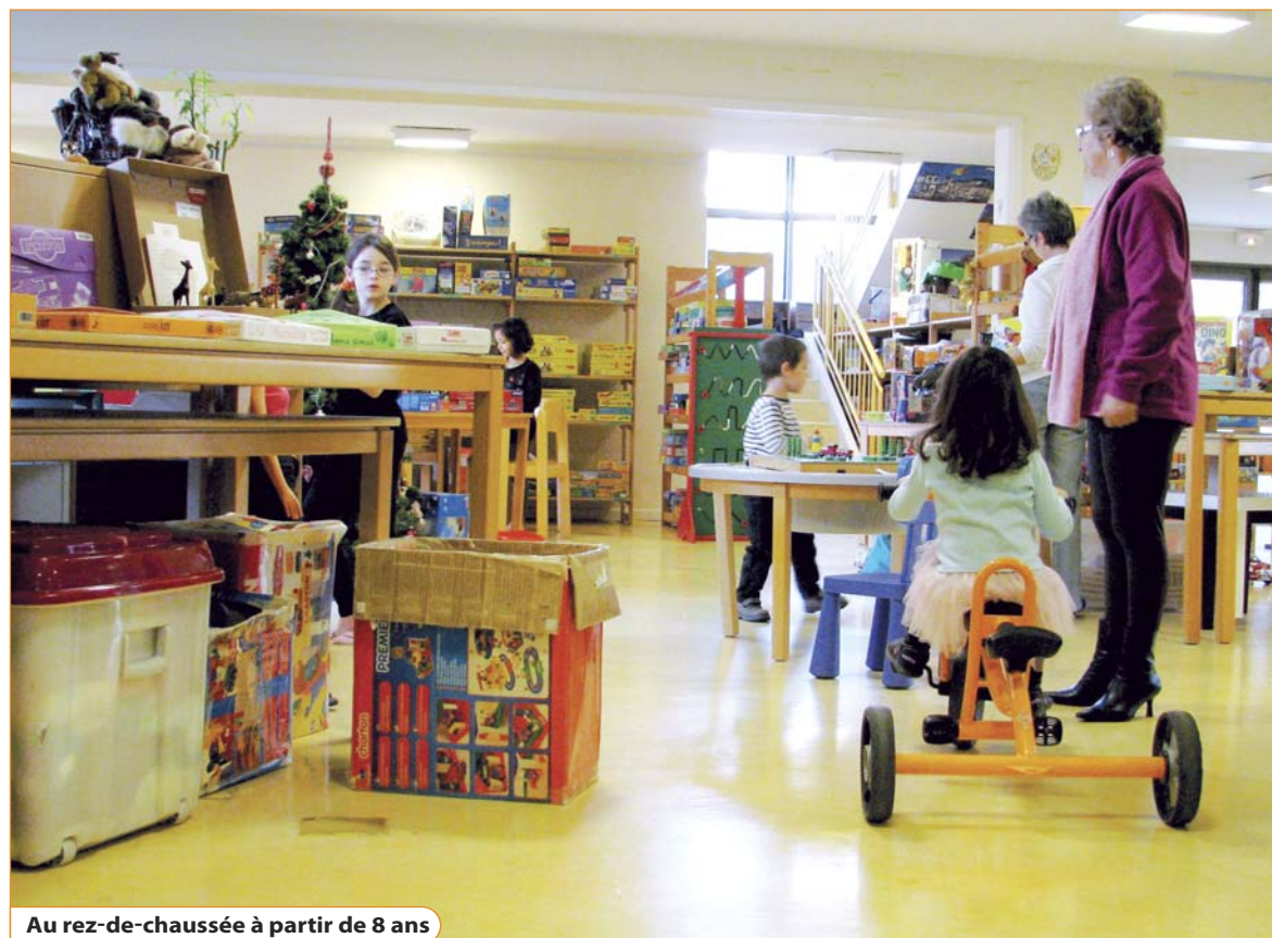
Au rez-de-chaussée à partir de 8 ans