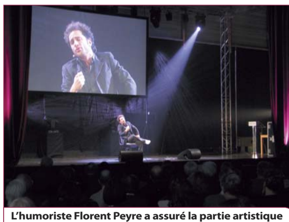
L'humoriste Florent Peyre a assuré la partie artistique