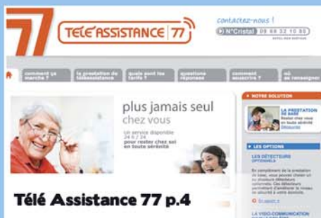
Télé Assistance 77 p.4