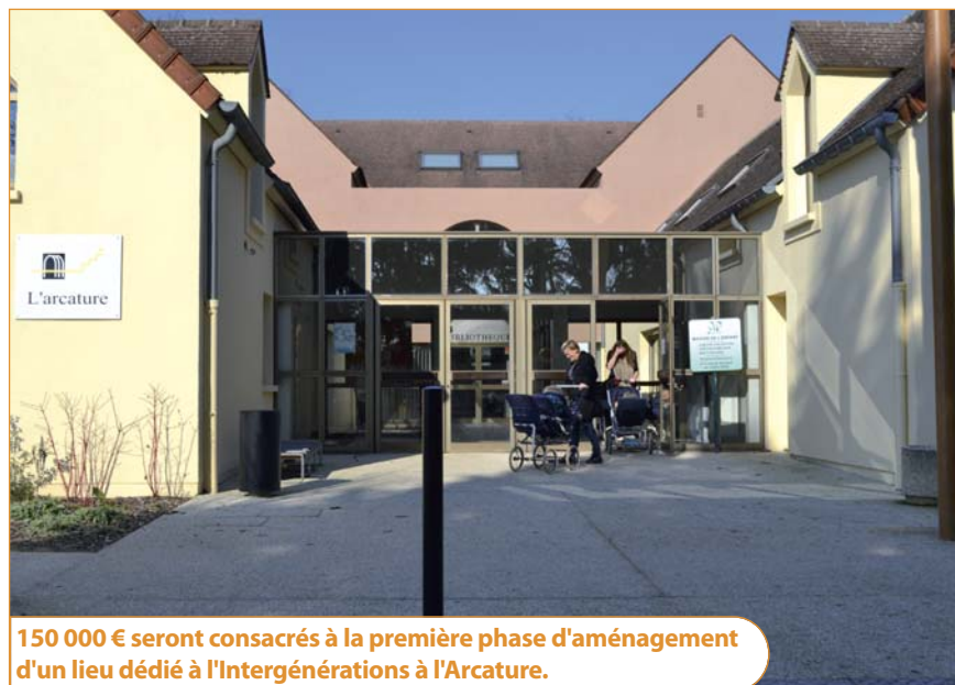
150 000 € seront consacrés à la première phase d'aménagement d'un lieu dédié à l'Intergénération à l'Arcature.

Vous pouvez retrouver l'intégralité des débats du conseil municipal du 31 janvier sur le site internet de la Ville : www.mairie-vaux-le-penil.fr