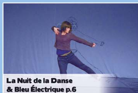
La Nuit de la Danse & Bleu Électrique p.6