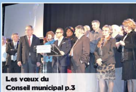
Les vœux du Conseil municipal p.3