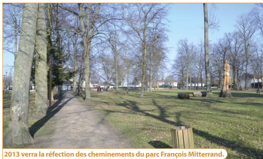
2013 verra la réfection des cheminements du parc François Mitterrand.