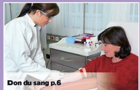
Don du sang p.6