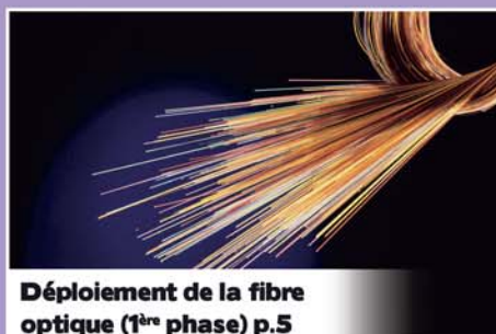
Déploiement de la fibre optique (1 ère phase) p.5