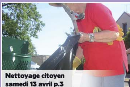
Nettoyage citoyen samedi 13 avril p.3