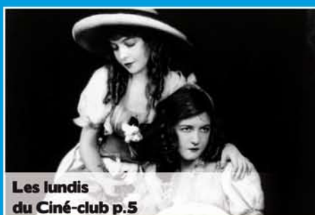
Les lundis du Ciné-club p.5