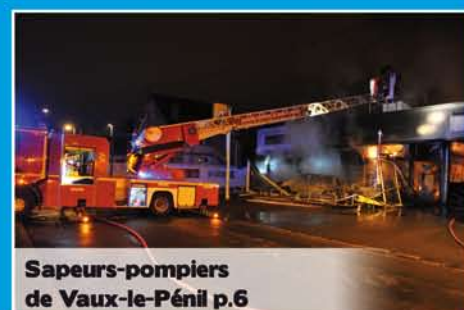
Sapeurs-pompiers de Vaux-le-Pénil p.6