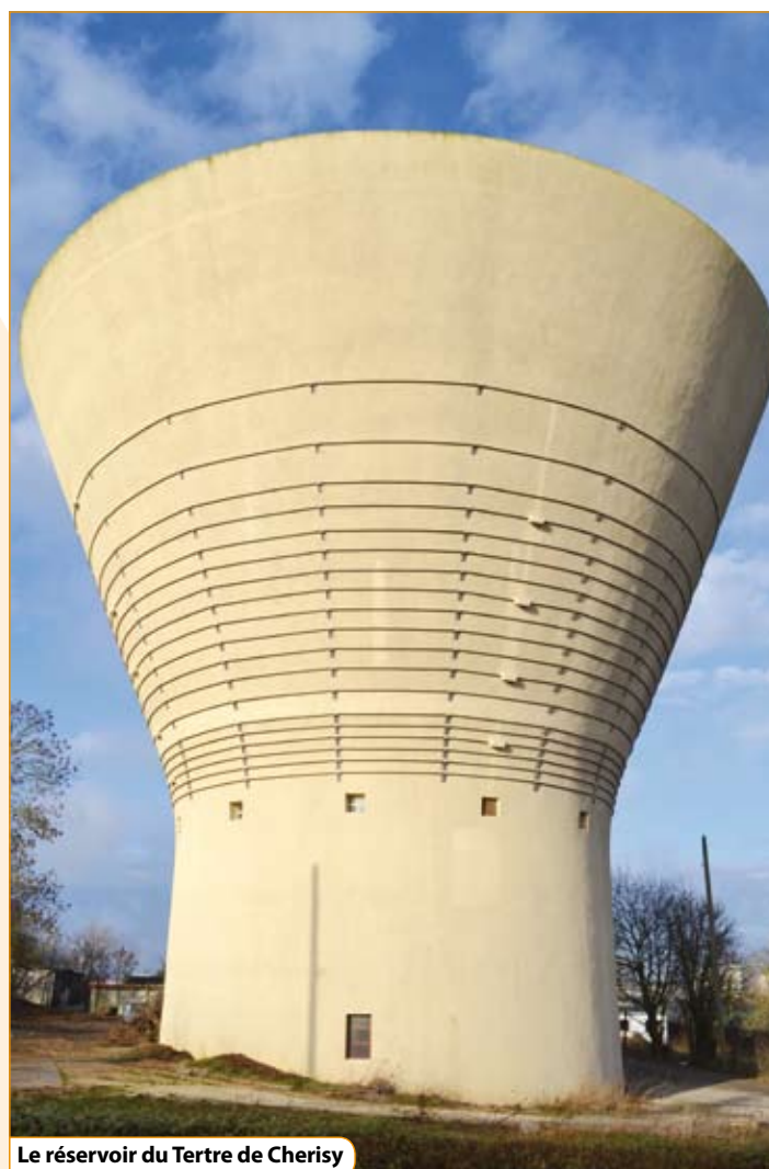
Le réservoir du Tertre de Cherisy

Veolia Eau est le délégataire du service public d'assainissement de la CAMVS.