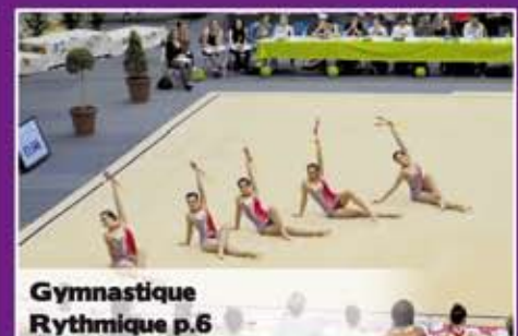
Gymnastique Rythmique p.6