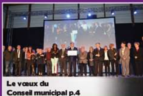
Le vœux du Conseil municipal p.4