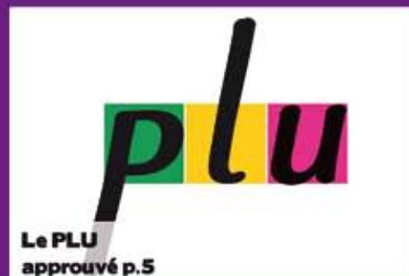
Le PLU approuvé p.5