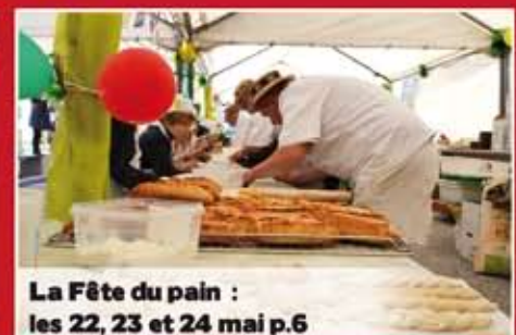
La Fête du pain : les 22, 23 et 24 mai p.6