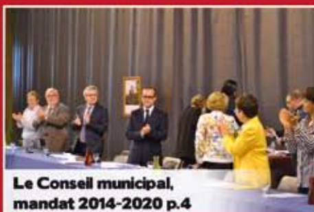
Le Conseil municipal, mandat 2014-2020 p.4