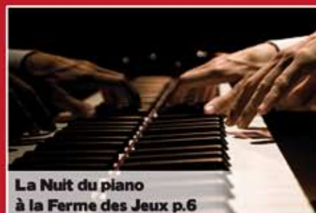
La Nuit du piano à la Ferme des Jeux p.6