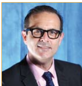
Pierre HERRERO Maire de Vaux-le-Pénil