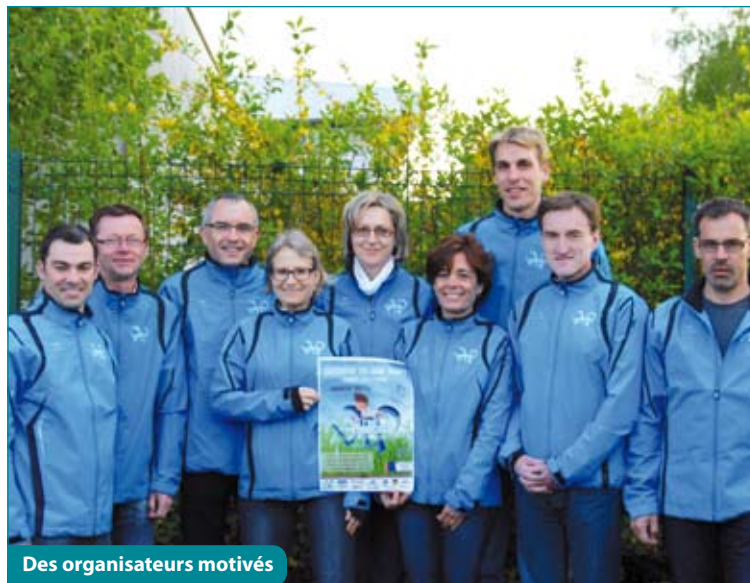
Des organisateurs motivés