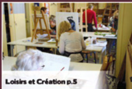
Loisirs et Création p.5