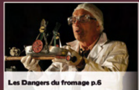
Les Dangers du fromage p.6