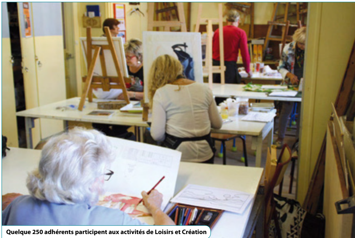
Quelque 250 adhérents participent aux activités de Loisirs et Création

Elle est l'une des plus anciennes associations pénivauxoises en activité. Sans se reposer sur ses acquis, Loisirs et Création propose, chaque rentrée, de nouveaux ateliers manuels, artistiques et culturels à destination de toute la famille.