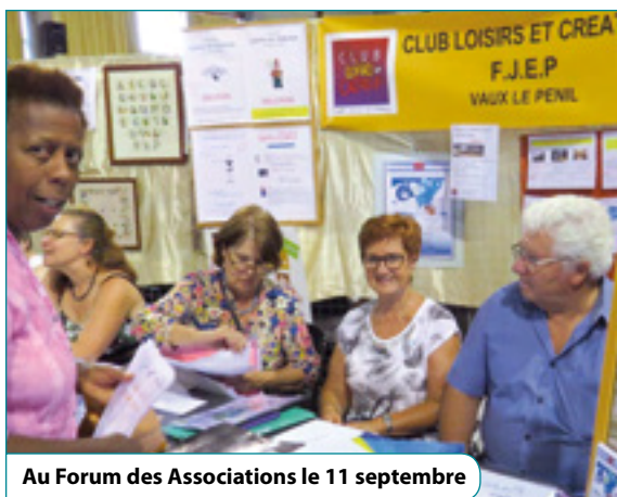
Au Forum des Associations le 11 septembre