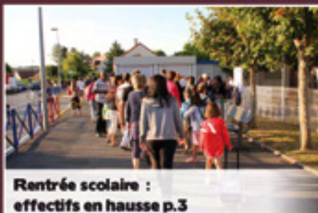
Rentrée scolaire : effectifs en hausse p.3