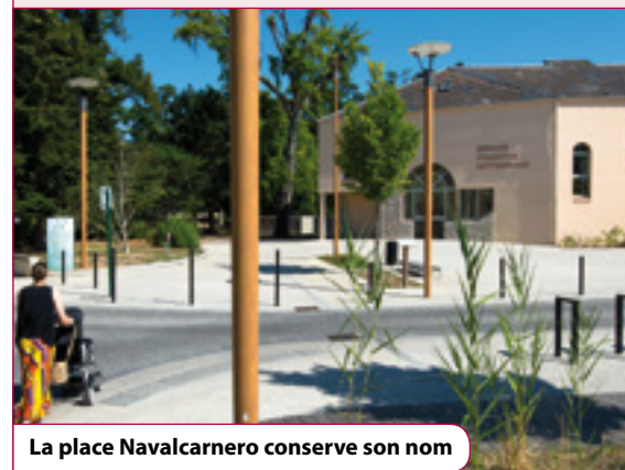
La place Navalcarnero conserve son nom