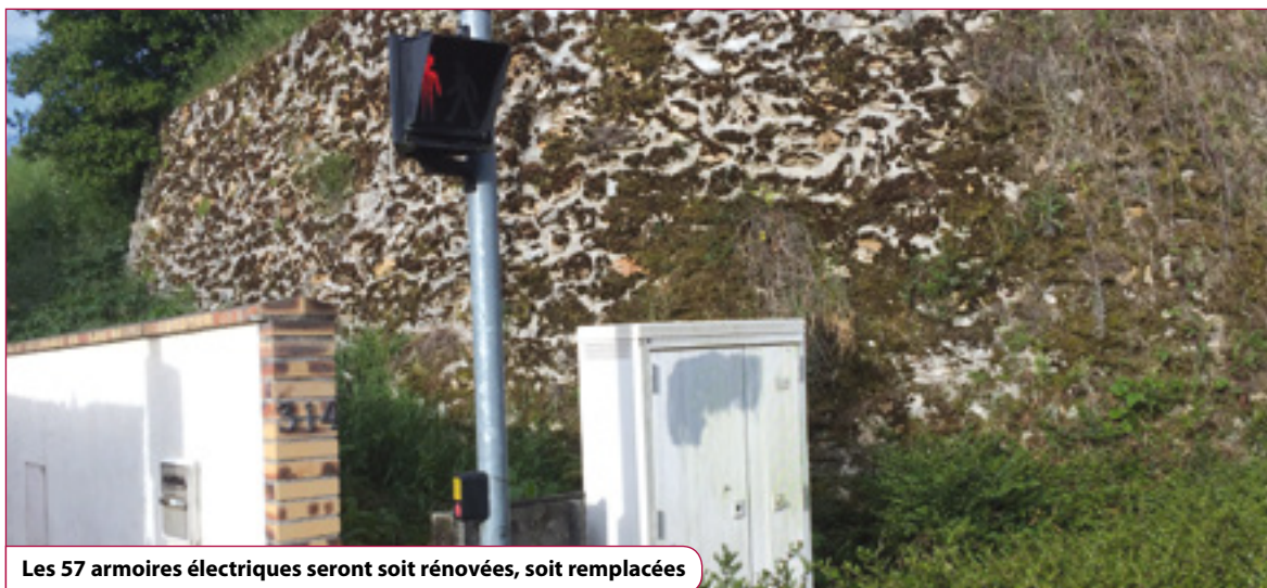
Les 57 armoires électriques seront soit renouvelées, soit remplacées

Quant aux 57 armoires électriques chargées de piloter l'ensemble de l'éclairage public, elles seront pour moitié renouvelées et pour l'autre moitié remplacées. « Elles seront toutes équipées d'horloges astronomiques afin d'éviter les problèmes qu'il nous arrive de rencontrer avec les cellules photo électriques dont le déclenchement peut être perturbé, notamment lorsque la végétation s'en mêle » poursuit Jean-Pierre Nogacz. Selon les secteurs, différents types de mâts et de luminaires - offrant des intensités de lumières plus ou moins fortes - seront installés afin de renforcer la sécurité des piétons et des automobilistes. « Nous consacrerons chaque année environ 200 000 € en investissement pour la rénovation des mâts, des armoires électriques et des luminaires, et 125 000€ en fonctionnement pour la maintenance de l'ensemble des installations de l'éclairage public, ce qui représente un effort conséquent pour la commune, indique Anselme Malmassari, premier adjoint au maire chargé des finances. Mais à l'issue du contrat, et au-delà des aspects de sécurité, nous bénéficierons d'une économie de réduction de 42% sur notre consommation électrique, dont le coût s'élève actuellement à plus de 140 000 € par an. » Reflets rendra régulièrement compte de l'avancée de ce chantier majeur dont les premières actions sont programmées en 2018.