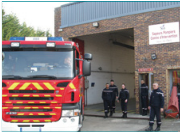
Le centre de secours ouvre ses portes au public pour la 1 ère fois

Restauration sur place Entrée et parking gratuit Centre d'Incendie et de Secours 109, rue Pascal. Renseignements au : 01 64 83 52 50