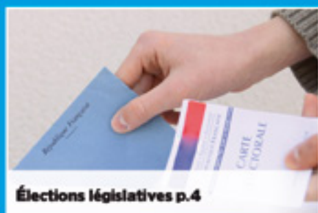
Élections législatives p.4