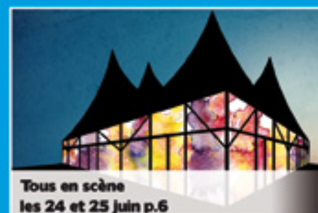
Tous en scène les 24 et 25 juin p.6