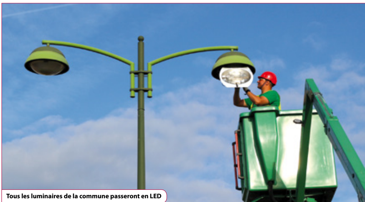
Tous les luminaires de la commune passeront en LED

La municipalité vient de lancer un vaste plan de rénovation de l'éclairage public sur l'ensemble du territoire de Vaux-le-Pénil. Ce marché à performance énergétique (MPE), est prévu pour s'étaler sur les 12 prochaines années. « La préparation de ce dossier a nécessité près de deux années de travail, avec l'établissement d'un diagnostic sur la commune concernant le recensement de l'ensemble de nos points lumineux, l'évaluation de leur état, l'étude affinée de leur environnement en fonction du trafic routier et piéton. À partir de ce constat un appel d'offres a été lancé selon la procédure d'un dialogue compétitif entre diverses sociétés concurrentes. Le marché a été attribué à la société SOBECA. À terme, tous les supports et luminaires vétustes seront remplacés. Cela concerne 844 mâts sur les 1 800 que compte la commune, et 1 650 luminaires qui passeront tous en LED » explique Alain Taffoureau, adjoint au maire chargé des travaux, des bâtiments et de la circulation. Les 5 carrefours à feux tricolores seront également concernés et traités de manière prioritaire. « Les automates qui gèrent ces feux sont anciens. Le MPE va nous permettre de les remettre aux normes et d'équiper les carrefours de signaux sonores et de bandes podotactiles pour les personnes souffrant de déficits visuels » souligne pour sa part Jean-Pierre Nogacz, responsable de ce dossier au sein des services techniques municipaux.