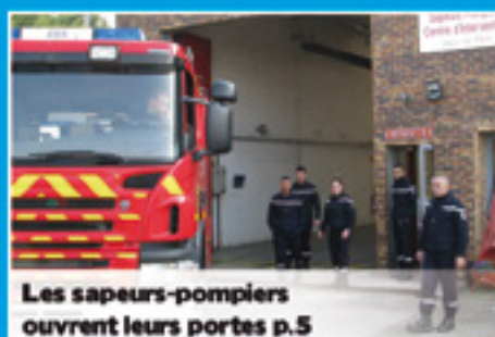
Les sapeurs-pompiers ouvrent leurs portes p.5