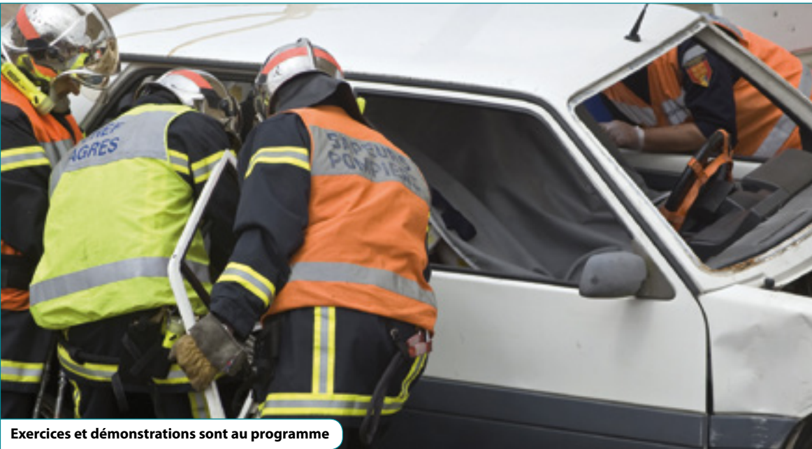
Exercices et démonstrations sont au programme

Journée de démonstrations et d'information samedi 24 juin de 10h00 à 18h00 au centre de secours rue Pascal.