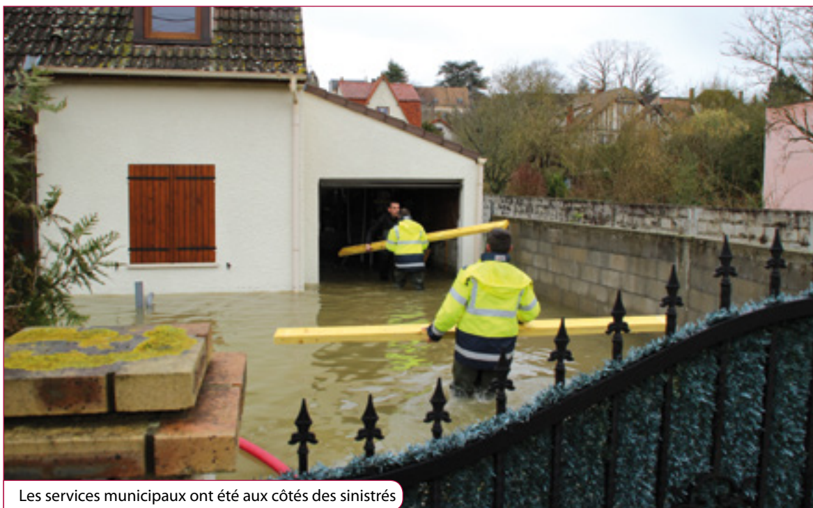
Les services municipaux ont été aux côtés des sinistrés