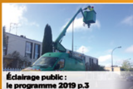
Éclairage public : le programme 2019 p.3