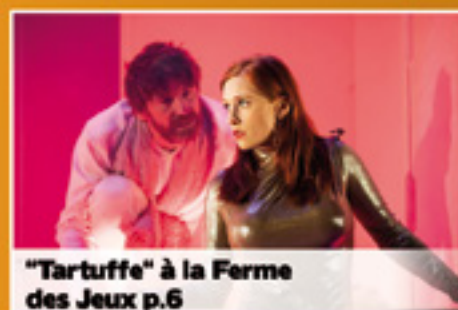
"Tartuffe" à la Ferme des Jeux p.6