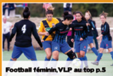
Football féminin, VLP au top p.5