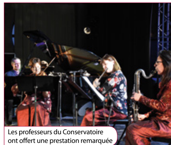
Les professeurs du Conservatoire ont offert une prestation remarquable