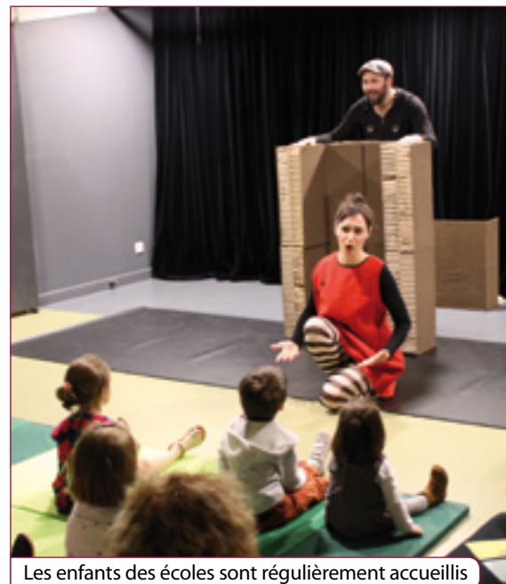
Les enfants des écoles sont régulièrement accueillis

Les abonnés de la bibliothèque de l'Arcature peuvent désormais réserver leurs livres en ligne, prolonger leur emprunt, consulter l'intégralité du fonds à leur disposition ou encore accéder aux ressources numériques de Medialib77 sur www.biblio.mairie-vaux-le-penil.fr .