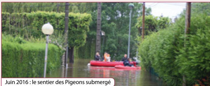
Juin 2016 : le sentier des Pigeons submergé

En l'espace de 18 mois, les riverains de la route de Chartrettes subissaient deux inondations majeures. Lors de la première, en juin 2016, la Seine atteignait 5,60 mètres à Melun au pic de la crue, soient 45 centimètres de plus qu'en 1982. En mars 2018, la seconde, bien que moins importante, avait sérieusement perturbé deux semaines durant la vie des riverains et causé des dégâts perceptibles plusieurs mois dans certaines habitations. La Ville, accompagnée par de nombreux bénévoles, avait mobilisé ses moyens humains et techniques pour être à leurs côtés durant ces moments difficiles.