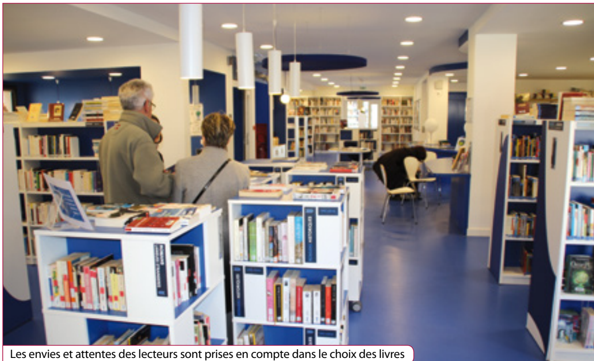
Les envies et attentes des lecteurs sont prises en compte dans le choix des livres

Disposant d'un fond de plus de 54 000 ouvrages pour 1400 abonnés, la bibliothèque municipale propose également de nombreuses activités gratuites ainsi qu'un espace numérique doté d'ordinateurs et tablettes. Rencontre avec Anne-Marie Le Guhenec, responsable de la structure depuis 4 ans.