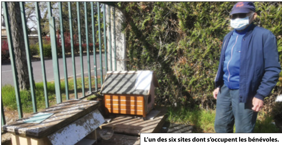
L'un des six sites dont s'occupent les bénévoles.

Tout au long de l'année, de nombreux chats, nés dans la rue ou abandonnés lâchement, peuplent les trottoirs de Vaux-le-Pénil. Rencontre avec l'association pénivauvoise Vaux Chats, qui protège les "chats libres" de la commune depuis 10 ans.