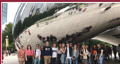
Jumelages : la jeunesse à l'honneur p.4