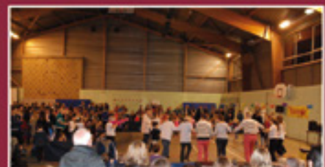
Téléthon 2017 : on compte sur vous ! p.6