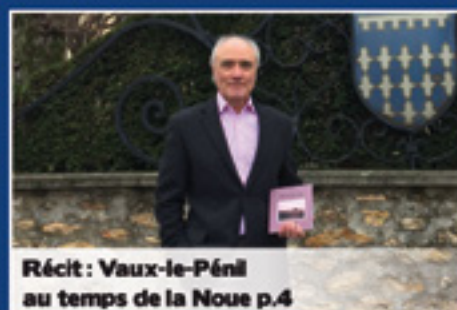
Récit : Vaux-le-Pénil au temps de la Noue p.4