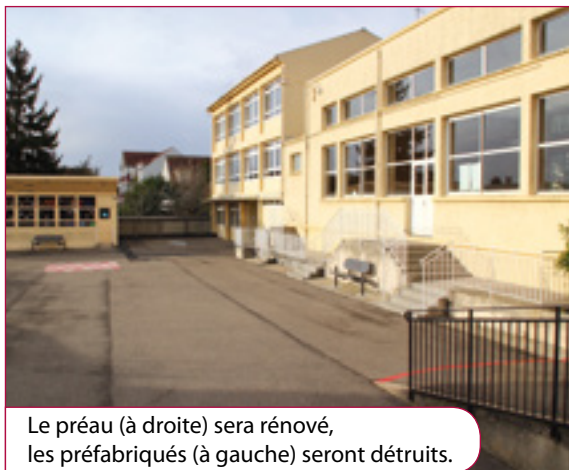
Le préau (à droite) sera rénové, les préfabriqués (à gauche) seront détruits.

Les travaux de rénovation de l'accueil périscolaire vont débiter dans les prochaines semaines.