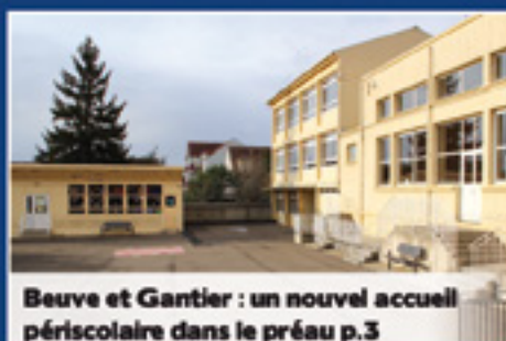
Beuve et Gantier : un nouvel accueil périscolaire dans le préau p.3