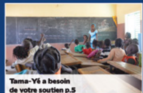
Tama-Yé a besoin de votre soutien p.5