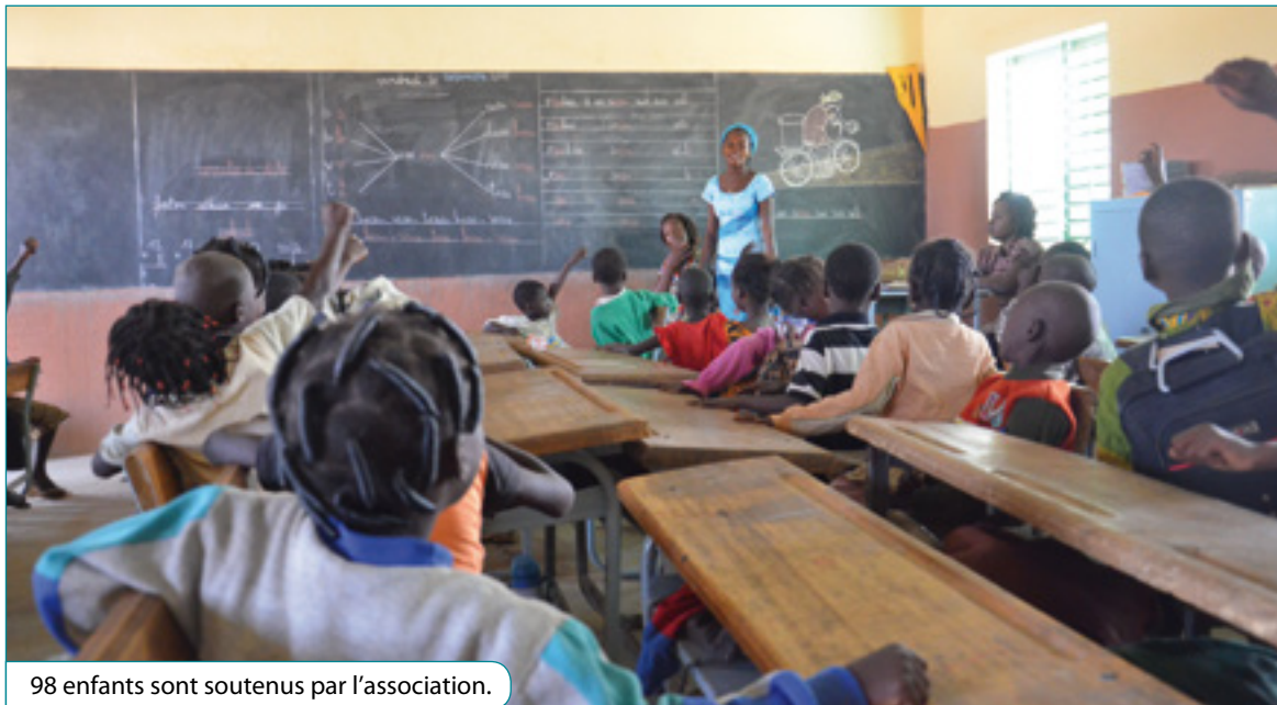
98 enfants sont soutenus par l'association.

Aide à la scolarisation, sauvegarde de l'enfance en danger (vêtements, nourriture...), secours d'urgence en cas de famine... L'association "Tama Yé", qui signifie symboliquement "Il y a de l'espoir", est une association pénivauxoise qui aide au maintien des enfants orphelins du Burkina Faso dans leur famille. Cette année, 5 étudiants ont besoin de votre soutien.