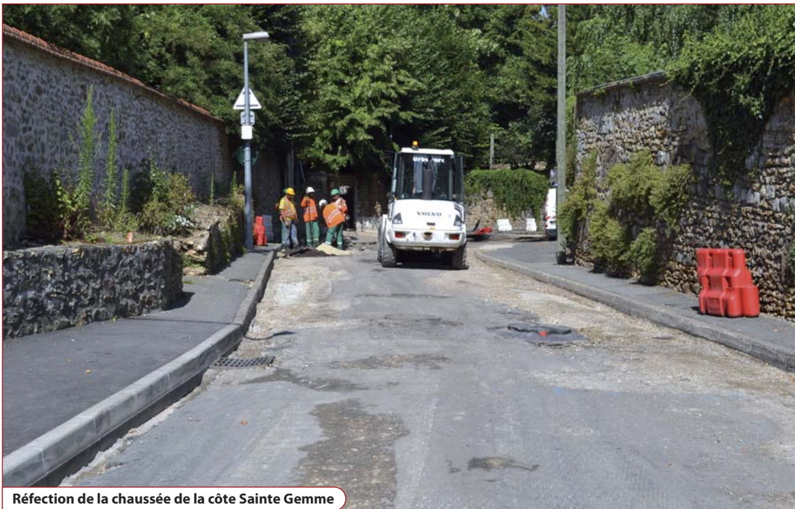
Réfection de la chaussée de la côte Sainte Gemme