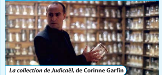
La collection de Judicaël, de Corinne Garfin

Soirée exceptionnelle de courts métrages, lundi 16 septembre à 20h00 (durée : environ 3 heures)