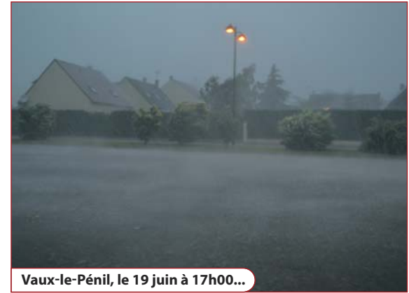
Vaux-le-Pénil, le 19 juin à 17h00...

Après les bassins du Germenoy (d'une capacité de 2 500 m 3 ) et du square du 19-Mars, la CAMVS en financera la construction d'un troisième, dans les prochains mois, place des Fêtes, d'une capacité de 5 500 m 3 . « La configuration topographique de Vaux-le-Pénil la rend particulièrement vulnérable aux fortes pluies », insiste Fabrice Julien, « d'où la grande utilité des bassins de rétention ».