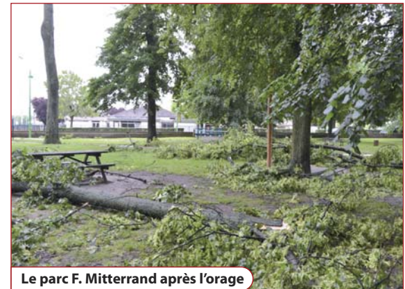
Le parc F. Mitterrand après l'orage