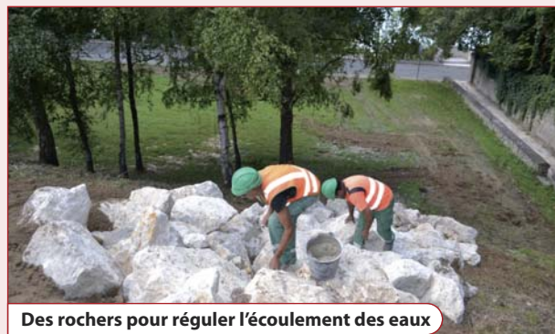
Des rochers pour réguler l'écoulement des eaux

Les travaux de réfection décidés dans la foulée étaient bien entamés lorsque le 26 juillet, un nouvel orage de forte intensité a frappé notre commune, ravinant plus encore la chaussée déjà fragilisée. De nouveaux travaux, portant cette fois sur la réfection complète de la route, l'amélioration de l'écoulement des eaux et la reprise des trottoirs, ont été entrepris au début du mois d'août. « Je tiens à saluer la parfaite coopération entre les services du Département, de la CAMVS et de la Ville, qui a permis une prise de décision rapide et efficace, dans l'intérêt de tous les usagers de la Côte Sainte-Gemme » souligne Pierre Herrero, maire de Vaux-le-Pénil. À l'heure où ces lignes étaient écrites, la réouverture de la voie à la circulation était prévue pour les tous premiers jours de septembre.