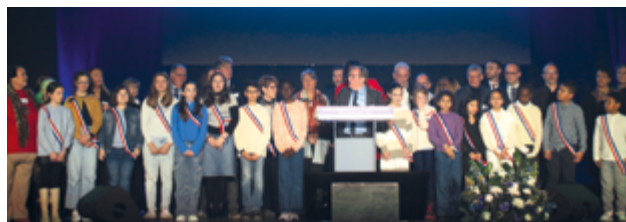
Membres des Conseils Municipaux d'Enfants et de Jeunes

Cette cérémonie a aussi été l'occasion de découvrir "French Wingz", un groupe de danseurs issus d' Incroyable Talent , qui a apporté, rythme, humour et poésie à ce moment festif. Saluons également la très belle prestation du groupe constitué de nos professeurs de musique qui a assuré une ambiance conviviale et jazzy autour d'un cocktail partagé.